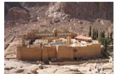
Монастир святої Катерини

Найстаріша діюча бібліотека знаходиться в Монастирі Святої Катерини на Синайському півострові в Єгипті. Побудована в середині VI ст., є другою, за розмірами, колекцією релігійних матеріалів у світі (після Ватикану). Вона закрита для широкого загалу і взяти в ній книги можуть тільки монахи та запрошені студенти.