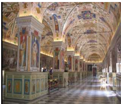
Сикстинська зала Ватиканської бібліотеки